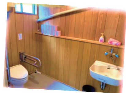
バリアフリー完備！

静岡市駿河区曲金4丁目15-16 ワークホームしずおか (地図は裏面をご覧ください。)